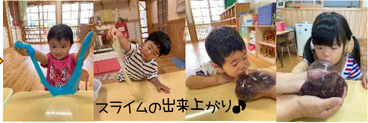
スライムの出来上がり♪