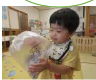
ピロマンできたかな?