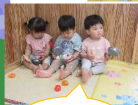
今日のご飯何作る?