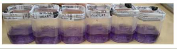
プラスチックの容器に入れて…