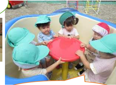
しんしんいまわして