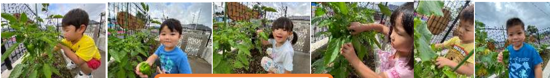
ピーマンたくさん取れたよ!