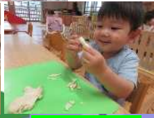
ぺったんぺったん