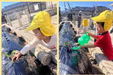
カリフラワーを植えたよ