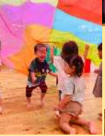
ぞうぐみさんと 体操教室