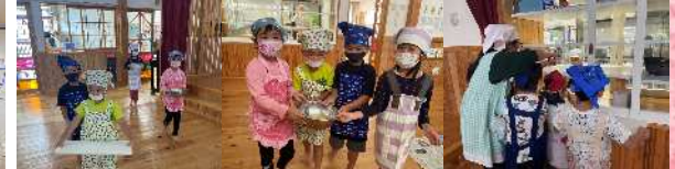
使った後のお片付けも みんなでするよ